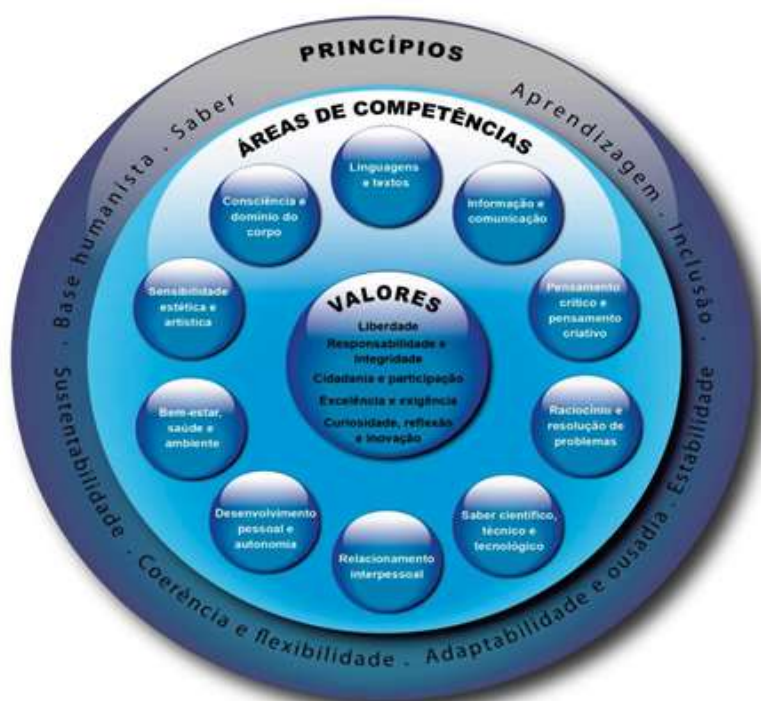
Figura 1 – Referencial do Perfil dos Alunos à Saída da Escolaridade Obrigatória

O AEPJS, ciente do Perfil dos Alunos à Saída da Escolaridade Obrigatória e, de acordo com a sua Missão, Visão, Princípios e Valores, procura contribuir para a formação de indivíduos capazes de olhar e viver o futuro de forma competente, autónoma, responsável e solidária.